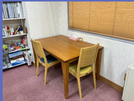
個人作業スペース