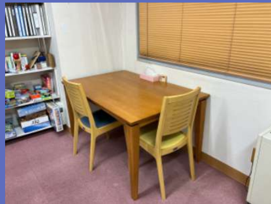
個人作業スペース